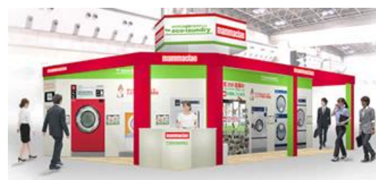
マンマチャオの出展ブースイメージ(小間番号 5447)